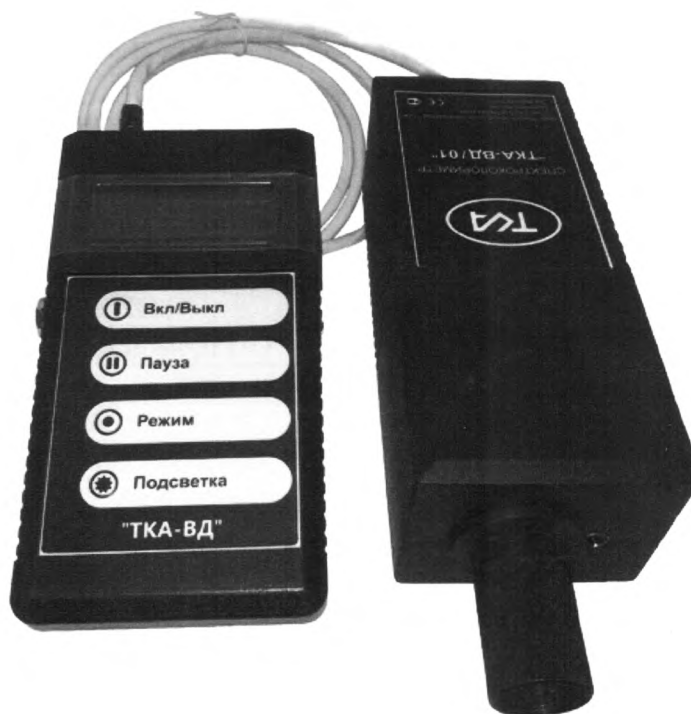
Рисунок 1 – Общий вид Спектроколориметров ТКА-ВД

Спектроколориметры имеют возможность отображения информации результатов измерения: координат цветности x , y ; u' , v' ; яркости L или освещенности E и цветовой коррелированной температуры T_c на встроенном ЖКИ и (или) на экране компьютера.